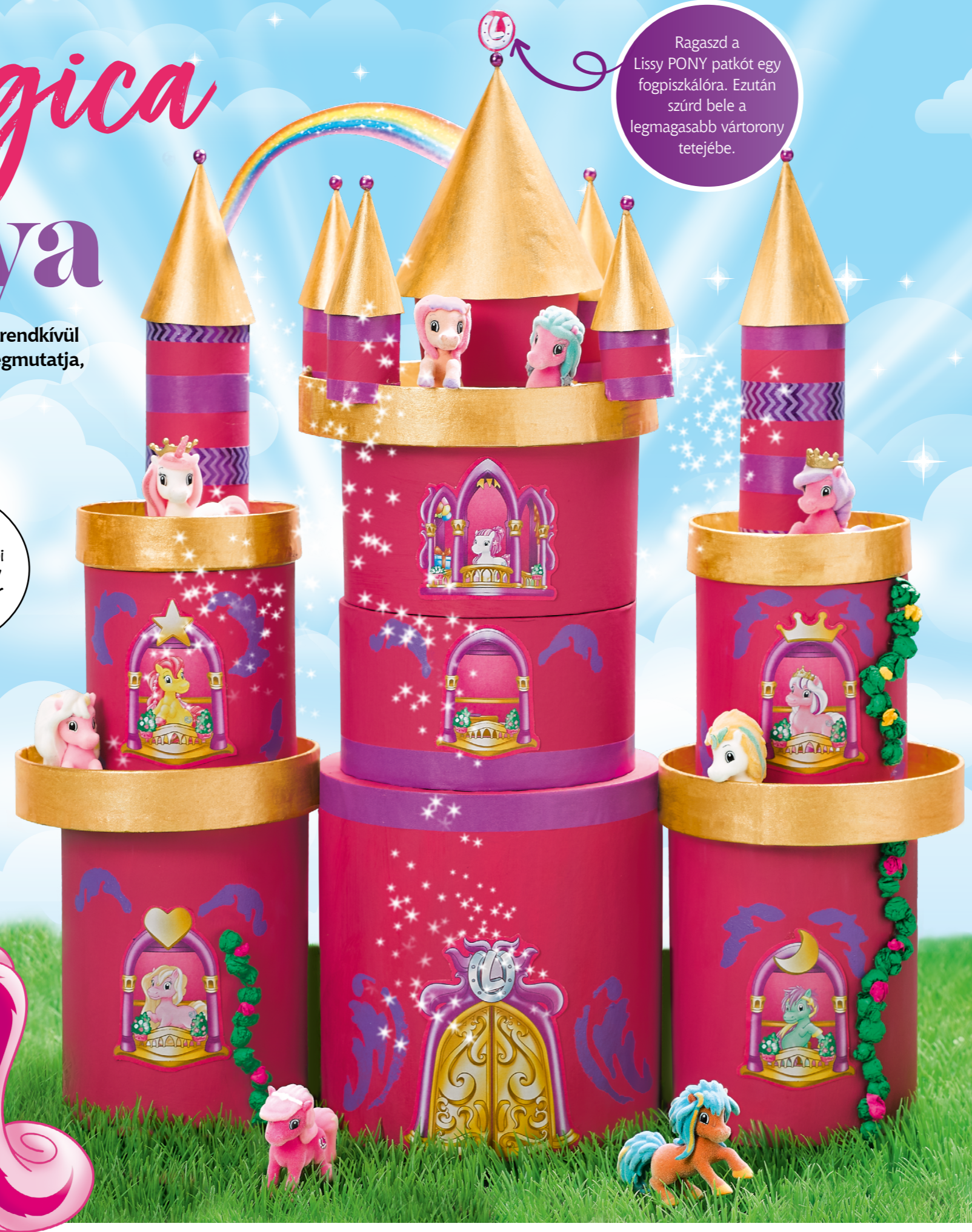
Az elkészítés lépéseit illusztrálta: Kristina Stroh.

Ragaszd a Lissy PONY patkót egy fogpiszkálóra. Ezután szúrd bele a legmagasabb vártorony tetejébe.